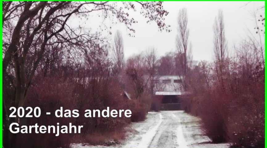
2020 - das andere Gartenjahr

Bitte bleiben Sie gesund und auf Abstand, damit wir uns in der nächsten Saison alle wieder am Gartenzaun grüßen können.